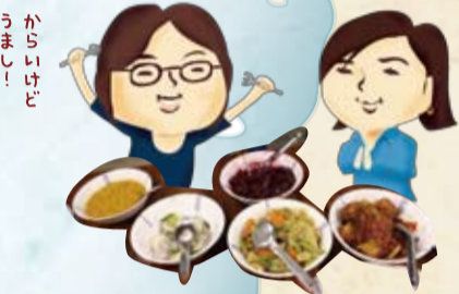
ついでにスリランカのオイシイおもてなし!