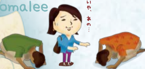
スリランカの最上級のあいさつが日本という土産状態! 本当に心から礼をつくすんですね。