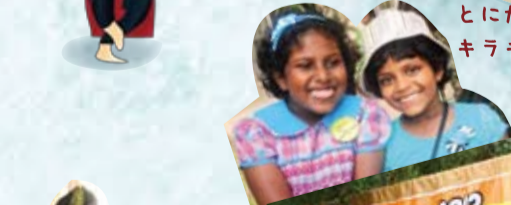
とにかく子ども達がキラキラ輝いています!

この日は、ダンスやコーラスをはじめとしたパフォーマンスのオーディション(予選)とアートワークショップが開催されました。オーディションを通過したグループが翌日の舞台上で発表するというのです。