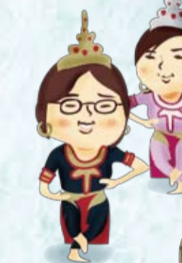
美しい伝統舞踊にうっとり...異国の文化ってほんとにすばらしい!