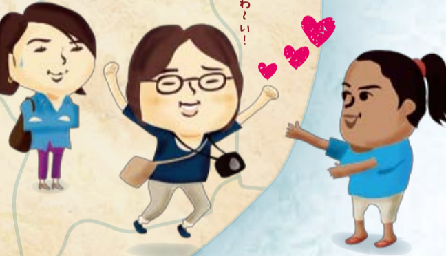
ドゥラクシと対面! あのすばらしいアートを描いたのは瞳のきれいな少女でした