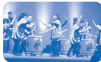
和太鼓サークル どん舞