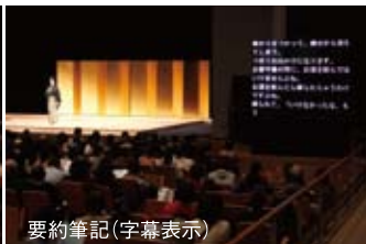
要約筆記(字幕表示)