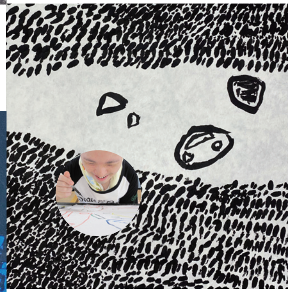
南 保孝(みなみ・やすたか) / アトリエやっほう!!

オレ、これ、好き! 絵を描くことのよろこび、 原初的なもの全部入っている。 はがすって気持ちいい。