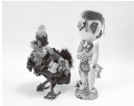
佐藤亜有子「shine / soldier」