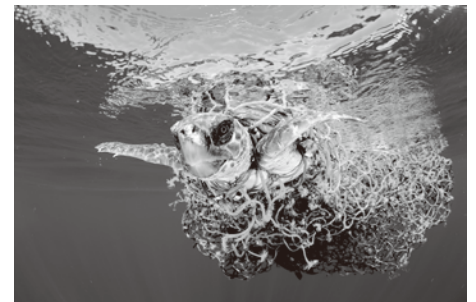
自然の部 単写真1位 フランシス・ベレス (スペイン) 2016年6月8日 (スペイン領カナリア諸島) スペイン領カナリア諸島のテネリフェ島沿岸で、 漁網に絡まり泳げずにいるウミガメ。

主に前年に撮影された写真を対象とした「世界報道写真コンテスト」の入賞作で構成される世界最大規模のドキュメンタリー・報道写真の展覧会です。普段目にする事の少ない現実を、鋭い視線で捉えるプロの報道カメラマン達。その圧倒的な力量で表現される受賞作品の数々は、ときに美しく、ときに厳しく、見る者の心に迫ります。