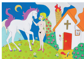
《花咲く夜の出来事》 Pinkskey 作