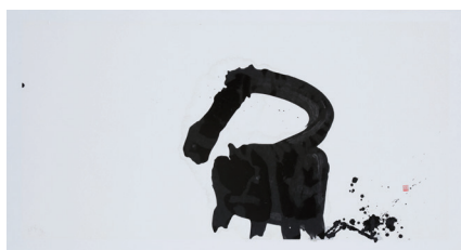
《魚》 林 開智 作