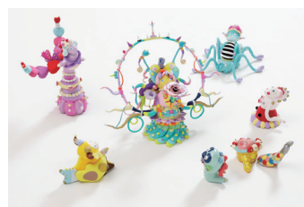
《願いを込めた先にある輝きの花》 濱口 颯馬 作