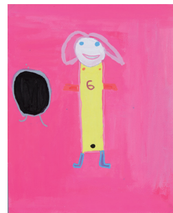
《It's me Gaby!》 Gaby Pesantes 作