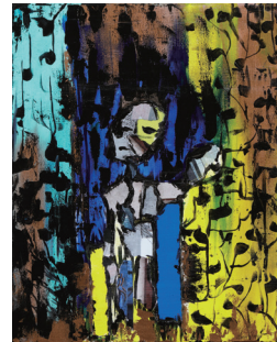
《NYC 2023》 Marven 作

本展覧会では、1,419 点の国内外応募作品の中から、各界で活躍する審査員により選出された、強く、美しいエネルギーを放つ 81 点をご紹介します。