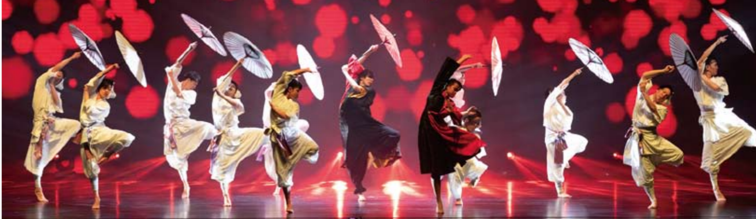
Photo by Ryohei Tomita Courtesy of The Nippon Foundation DIVERSITY IN THE ARTS