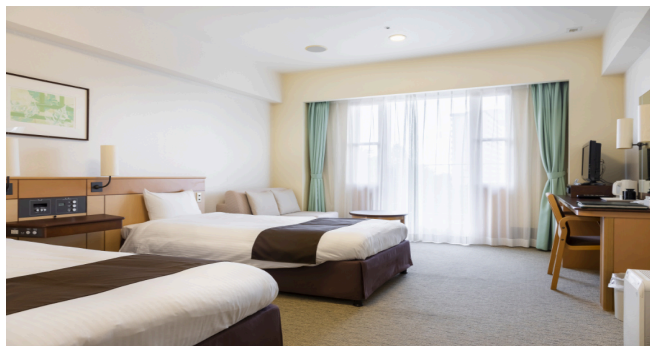
宿泊室(しゅくはくしつ)