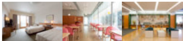
宿泊室 レストラン フロント