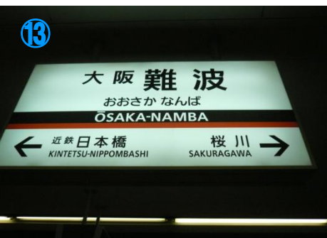
⑬大阪難波駅に到着 Get off “Osaka-Namba” Sta.