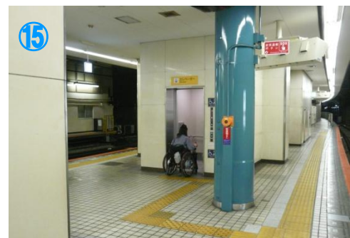
⑮ホームの西端に改札へのエレベーターが有り Lift is located west end of the station.