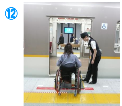
⑫親切な女性駅員さんが、渡し板を用意してくれました A kind staff helped.