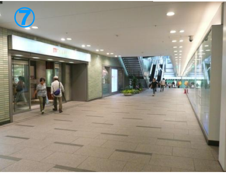
⑦地下1階に降りて、「阪神三宮」駅東口を目指して進みます When you reach B1 floor, go to “Hanshin-Sannomiya” east exit

Direction to BiG-i 06 From Kobe domestic airport