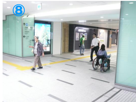
⑧少し距離が長いですが、段差もなく快適な通路です Long way to walk, but the floor is smooth for wheelchair.