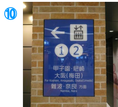
⑩東口にはエレベーター有り Lift to platform.