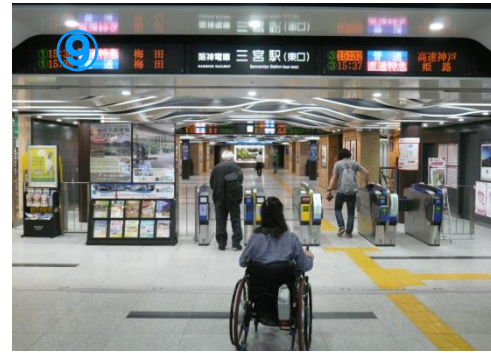
⑨阪神三宮駅東口に到着 “Hanshin-Sannomiya” Sta east exit