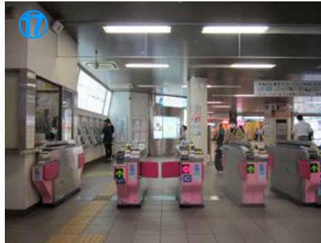
①⑦ 2つ目の「泉ヶ丘」駅で下車 所要7分 Get off the second stop "Izumigaoka" Sta in 7 minutes