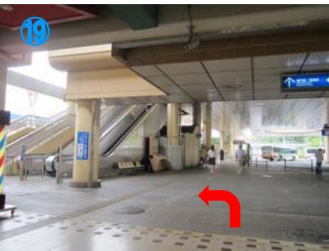
①⑨ バスロータリーの左、エスカレー ターの裏にエレベーターがあります Get on the lift behind the escalator, which is on left side of bus terminal.