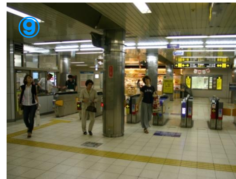
⑨終点の「なかもず」駅で降ります 所要38分 Get off the final stop “Nakamozu”. It takes 38 minutes