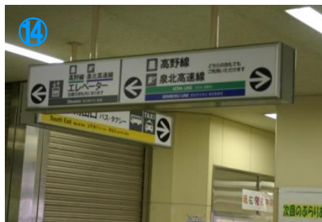
⑭改札は2つあります。 エレベーターがあるのは左側 Two ticket gates. Lifts to platform on the left side only.