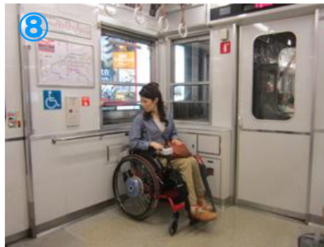
⑧車内には車いすスペース有り 通勤ラッシュ時は混雑します Wheelchair space on each train. Very crowded in morning rush hours.