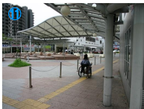
⑪地上に出て、南海「なかもず」駅へ 屋根があるので雨でも安心 Walk outside to Nankai “Nakamozu” Sta. There is a roof in the wheelchair route .