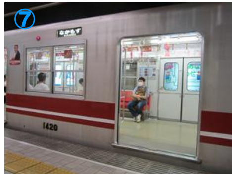
⑦「なかもず」行きに乗ります 2本に1本は「天王寺」行き Get on a train bound for “Nakamozu”. Half of trains are bound for Tennoji.

Direction to BiG-i 01 from Shinkansen Shin-Osaka station