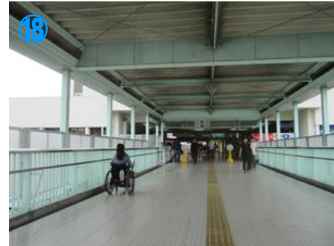
①⑧ 改札を出たら、右へ 歩道橋を渡り切ります Turn right and pass the bridge.