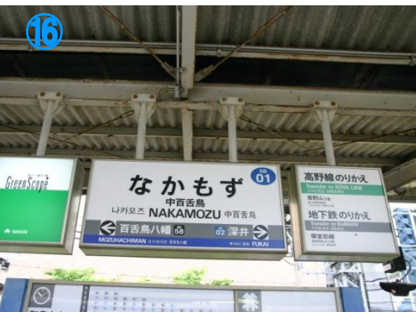
①⑥ 泉北高速「和泉中央」行き、 青色の線の乗ります Get on a train bound for "Izumi-chuo" usually has a blue line.

Direction to BiG-i 01 from Shinkansen Shin-Osaka station