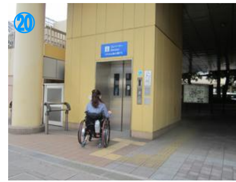
②⑩ エレベーターで2階へ Go to 2nd floor by this lift.