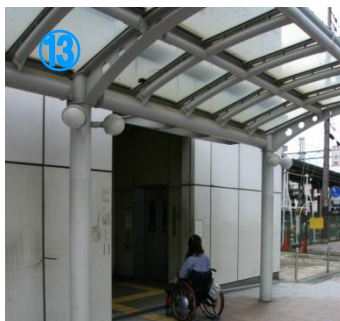
⑬エレベーターに到着 You can reach in front of the lift to Nankai Nakamozu Sta soon.