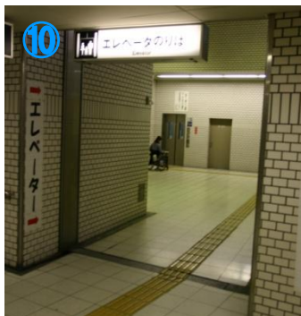
⑩改札を出て左へ、8番出口に エレベーターがあります Pass the ticket gate and turn left. Lift is located on #8 exit.