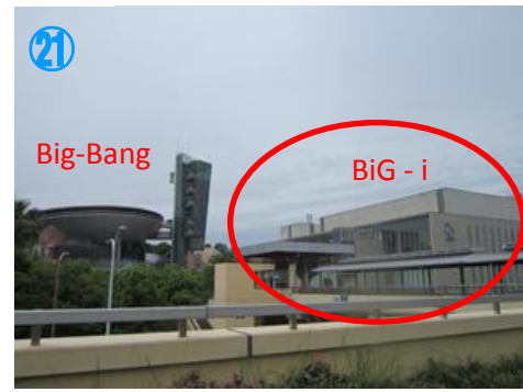
②⑪ ビッグアイが見えました！ 隣の円盤建物は「ビッグバン」 There is "BiG-i" next to the building "Big-Bang" like UFO flying disk.