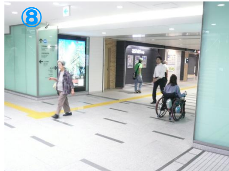
⑧少し距離が長いですが、段差もなく快適な通路です Long way to walk, but the floor is smooth for wheelchair.