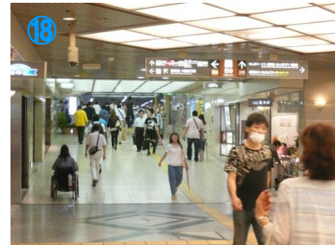
⑯大阪難波駅、西口改札 Hanshin / Kintestu "Osaka Namba" Sta west exit.