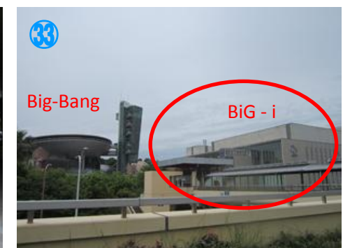
③⑪ バスロータリーの左、エスカレーター の裏にエレベーターがあります Get on the lift behind the escalator, which is on left side of bus terminal.